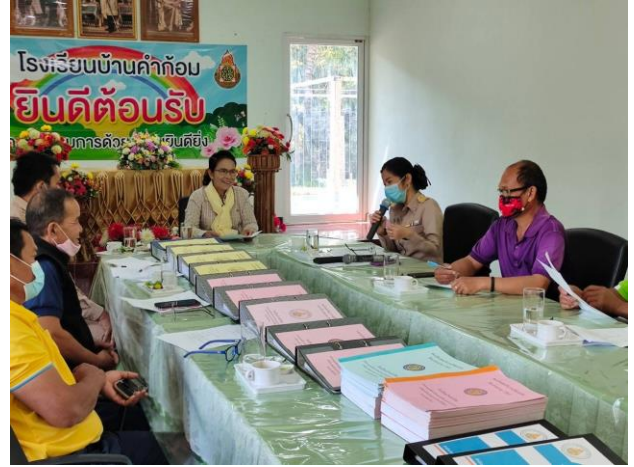
ภาพการประชุมคณะกรรมการสถานศึกษาขั้นพื้นฐาน ณ ห้องประชุมศรีตำบล โรงเรียนบ้านคำก้อม