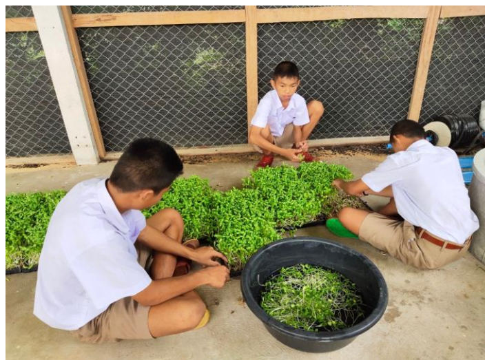
ดำเนินการตามโครงการคุณธรรม